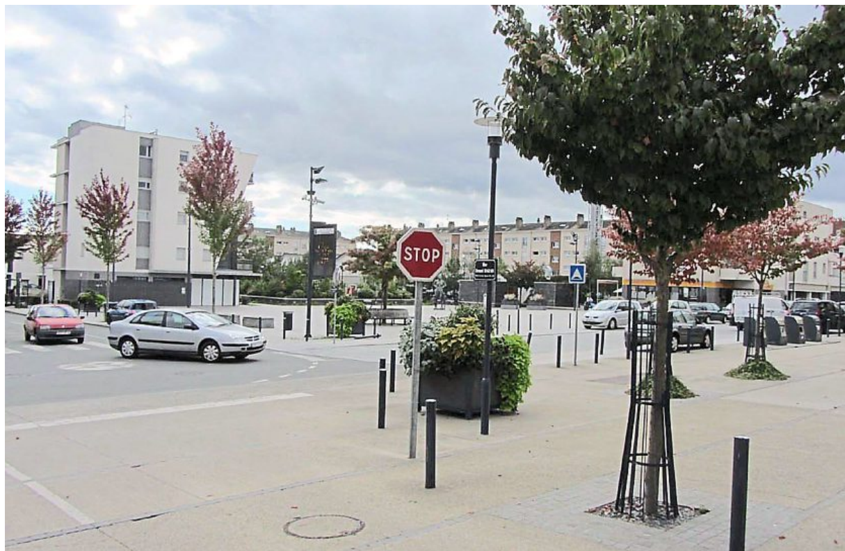
Le quartier du Grand Bellevue va profiter des mannes de l'état, via la dotation politique de la ville (DPV) pour soutenir diverses actions en cours et futures que la ville veut pérenniser.

L'insertion professionnelle, à travers une aide aux jeunes pour des formations qualifiantes, est aussi soutenue