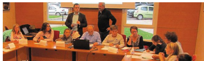
Le conseil des jeunes, réuni pour présenter les projets qu'ils avaient préparé.

Ils en ont de bonnes idées, les jeunes conseillers