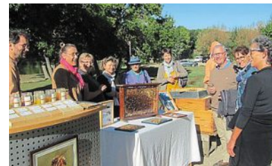
Des marcheurs accueillis par un producteur local de miel.

La rentrée scolaire, qui a eu lieu le 1 er octobre à Balambougou, concerne 200 élèves répartis en six classes.