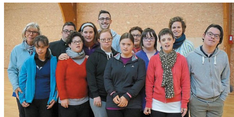
La compagnie de danse contemporaine Portraits jouera devant son premier public, vendredi 18 octobre, au Vallon des arts.

La compagnie Portraits dévoile sa première création