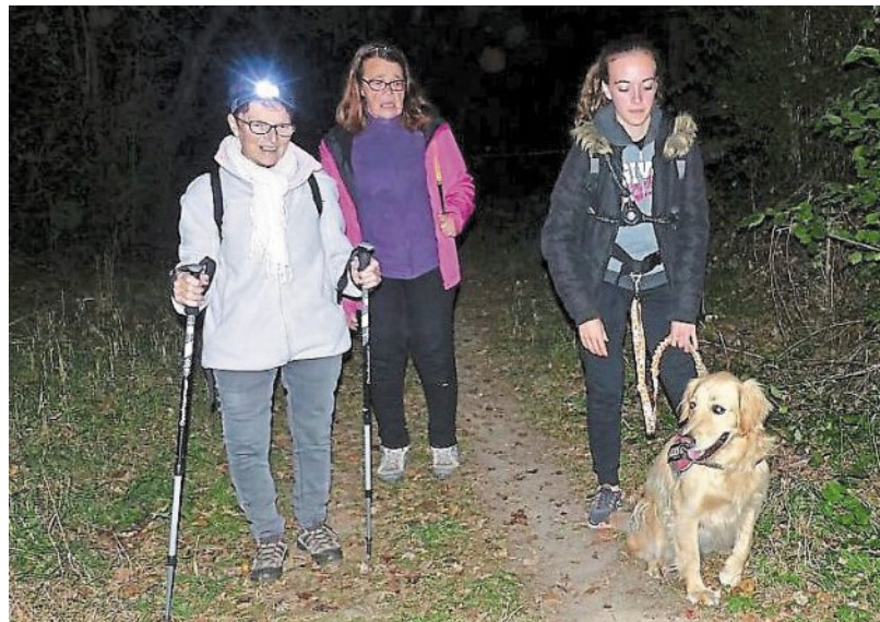
La nuit, tous les sens sont en éveil. La perception de l'environnement est différente.

Prêts pour la rando nocturne, ce samedi soir ?