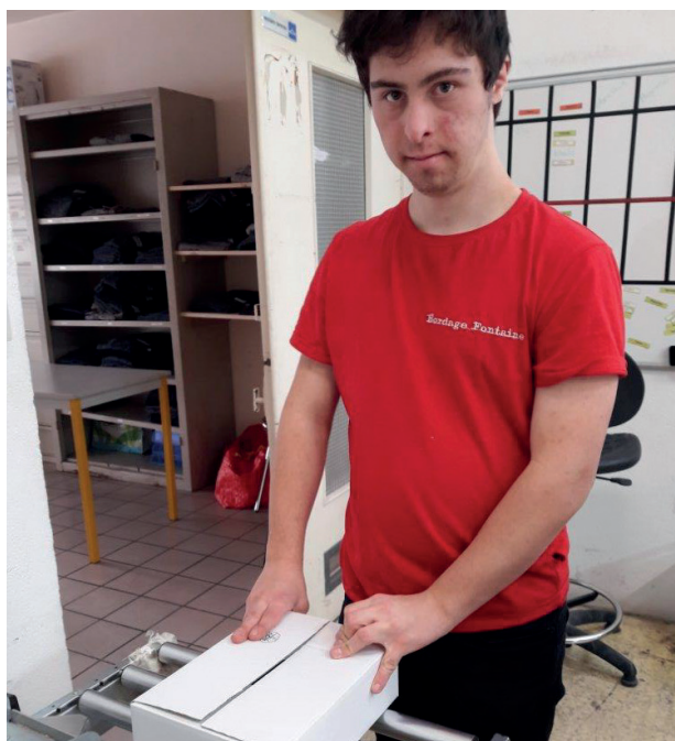
Mise en forme de cartons à l' EA APYSA

L'IME Bordage Fontaine adresse de sincères remerciements à l'ensemble de ces partenaires, sans qui, ces actions d'immersions professionnelles ne pourraient se développer.