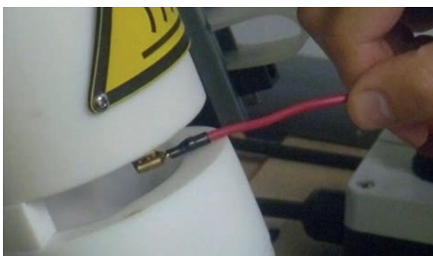
Atelier câblage à Sorema