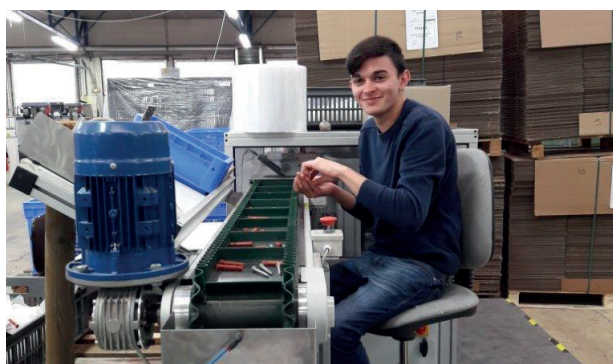
Conditionnement de visserie en sachets à l' EA APYSA