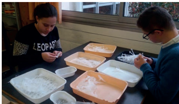
Dégrappage à l' ESAT Arc-en-Ciel