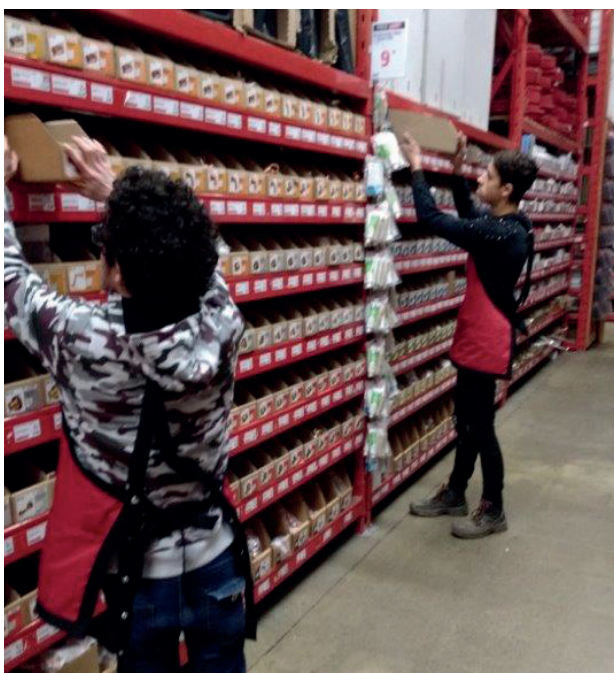
Rangement d'un rayon à Brico Dépôt