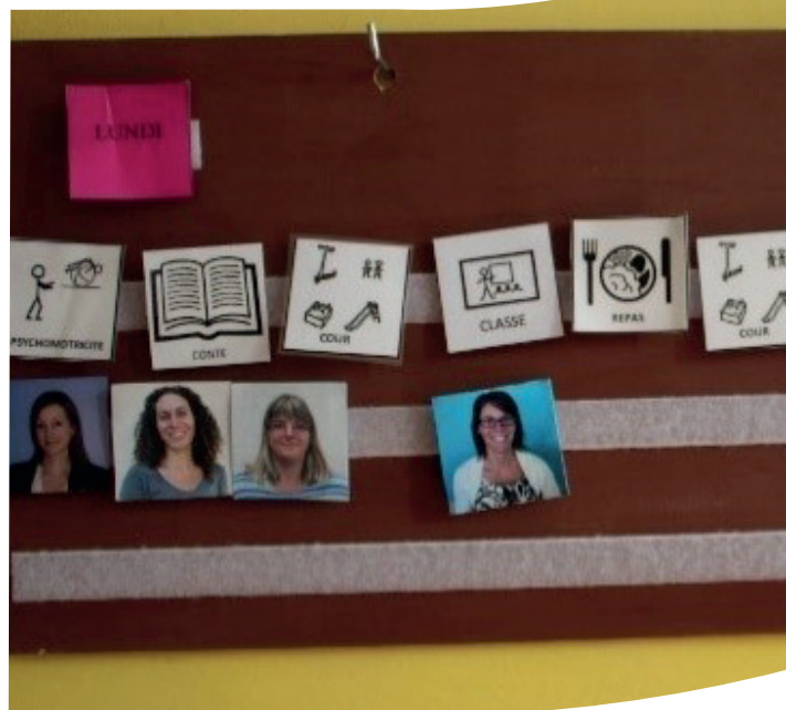
Une journée type d'un enfant à l'IME Champfleury en Makaton