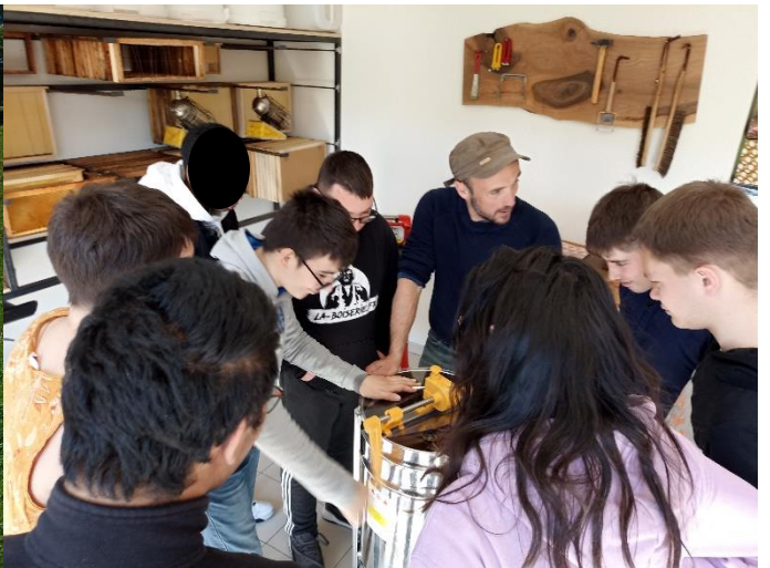
Les jeunes du SESSAD Europe