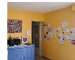
TABLEAU DES ACTIVITES, MENUS