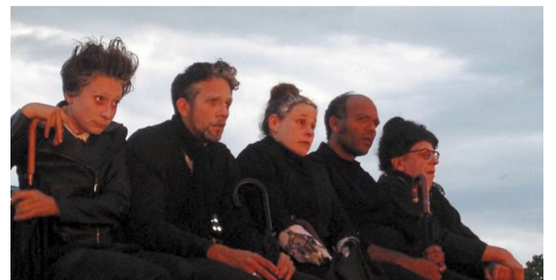
Dans le cadre de la 14 e tournée des villages, la compagnie Le temps est incertain mais on joue quand même a fait halte au port Albert. La troupe professionnelle a présenté une pièce de Balzac, « La Vieille fille ». Malgré la météo, 210 spectateurs étaient présents le 13 août.