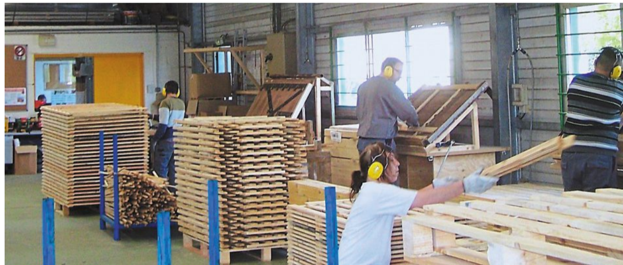
Les portes ouvertes organisées en mai ont eu du succès.

Depuis plusieurs mois, l'Adapei 49 fête ses 60 ans d'existence. L'association créée en 1969 au service des personnes handicapées mentales et de leurs proches milite pour une société inclusive, solidaire et respectueuse des différences. Cette année, chaque service aura sa fête jusqu'à l'automne. Soirées dan-