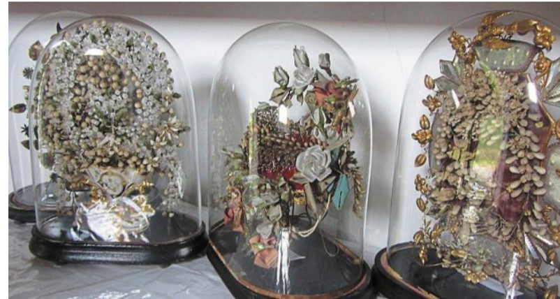
La chapelle abrite une trentaine de couronnes déposées par les jeunes mariées au lendemain des noces, sous la protection de la Madone.

statuette à l'église et on ferma la porte. Le lendemain même affaire, même constat. La Madone se plaisait dans son arbre. On renouvela l'expérience sans plus de succès. « C'était clair, commente le conteur, la Sainte-Vierge voulait rester là où on l'avait trouvée et elle trouva gain de cause dans son entêtement. » Un oratoire fut construit en ce lieu où l'arbuste avait accueilli la statuette. En 1766, une chapelle lui succéda, un « petit édifice à pignons élancés » comme le dit Henri Enguehard et qui a fait l'objet dans les années 70 d'une restauration sous le mandat du maire Christian Fouchet. On y célèbre aujourd'hui l'Assomption, en hommage à cette Madone qui a montré intérêt et obstination pour ce lieu. Une coutume rapportée par le journaliste voudrait que « les jeunes épousées de Saint-Léger-des-Bois aillent porter leur couronne protégée par un globe dans la chapelle de la Madone. » Coutume qui s'est perdue dans les années cinquante.