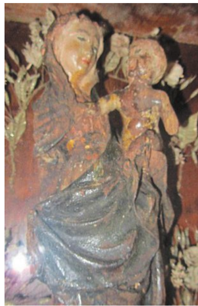
La statuette de la Vierge à l'enfant.

L'office religieux de l'Assomption s'est déroulé à la chapelle de la Touche-aux-Ânes, le 15 août. À l'intérieur, il y a l'antique statuette de la Vierge, aujourd'hui classée.