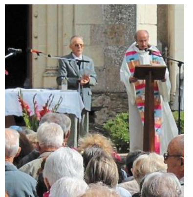
Les fidèles ont fêté l'Assomption.

Ceux qui le souhaitent se sont ensuite retrouvés pour un pique-nique dans la salle jouxtant la chapelle. Situé sur les circuits Loire à Vélo et Vélo Francette, ce lieu est ouvert tous les jours aux visiteurs,